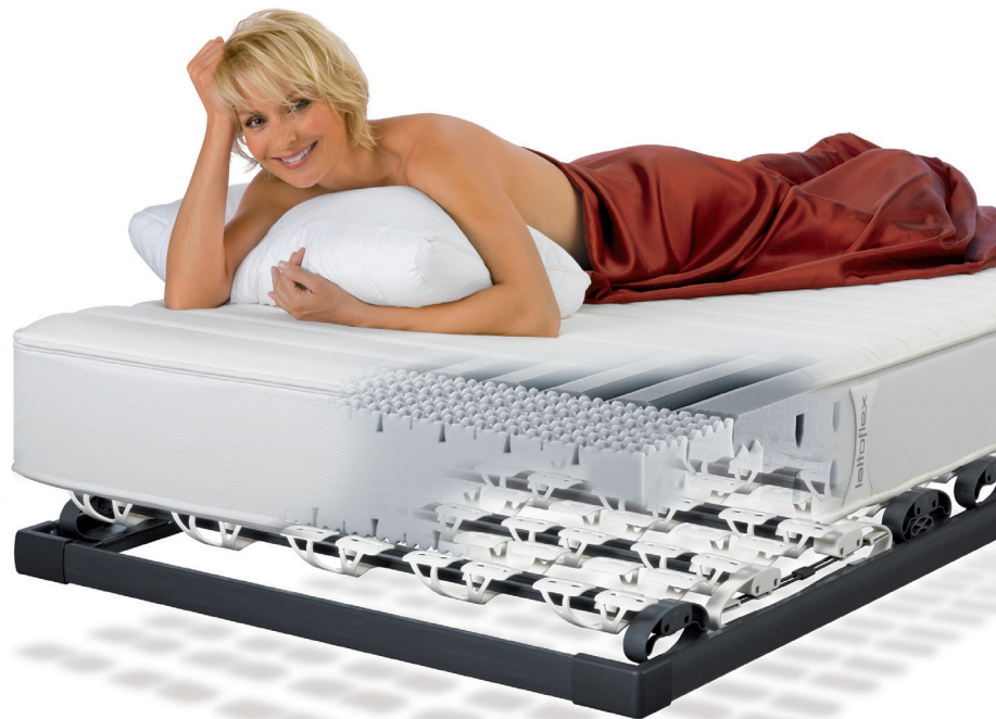
Lattoflex-Bettsysteme ermöglichen eine ergonomische Haltung der Wirbelsäule über Nacht.

ten Ergonomie im Arbeitsalltag und ausreichend Bewegung als Maßstab für ein ausgewogenes Verhältnis von Be- und Entlastung des Rückens. Doch das ist nicht alles: Denn fast ein Drittel des Lebens spielt sich im Bett ab.